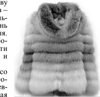
Тема выпуска: изделия из меха и пушнины

По материалам российских СМИ подготовил С. СЕРГЕЕВ.